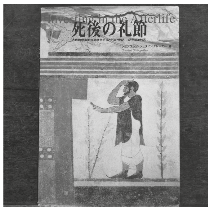
Fig. 3. Catalogo della Mostra "Investing in the Afterlife" nel 2000/2001 nel Tokyo University Museum.