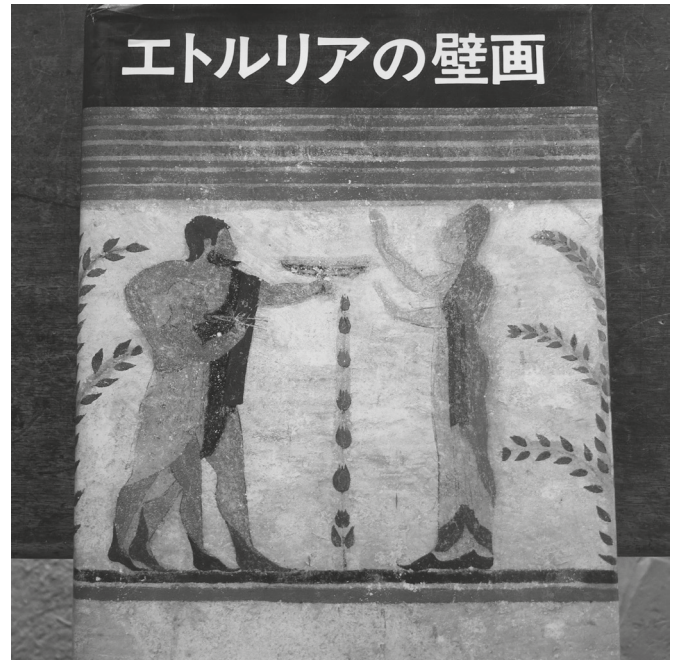
Fig. 5. Edizione giapponese del "Catalogo ragionato della pittura etrusca" del 1985.

Intanto la pittura funeraria etrusca ha acquistato una notevole popolarità in Giappone non solo attraverso la visita di turisti giapponesi nella Necropoli di Monterozzi. L'idea e il progetto di pubblicare per la prima volta una specie di corpus delle tombe dipinte etrusche hanno avuto origine in Giappone e sono stati realizzati in un grande libro-catalogo a cura di chi parla e sotto il patrocinio di Massimo Pallottino (allora Presidente dell'Istituto di Studi Etruschi e Italici) e Paola Pelagatti (allora Soprintendente dell'Etruria Meridionale e amica personale del maestro-fotografo T. Okamura) pubblicato nel 1985 cioè nell' "Anno degli Etruschi" in quattro lingue (giapponese, inglese, italiano e tedesco) da parte