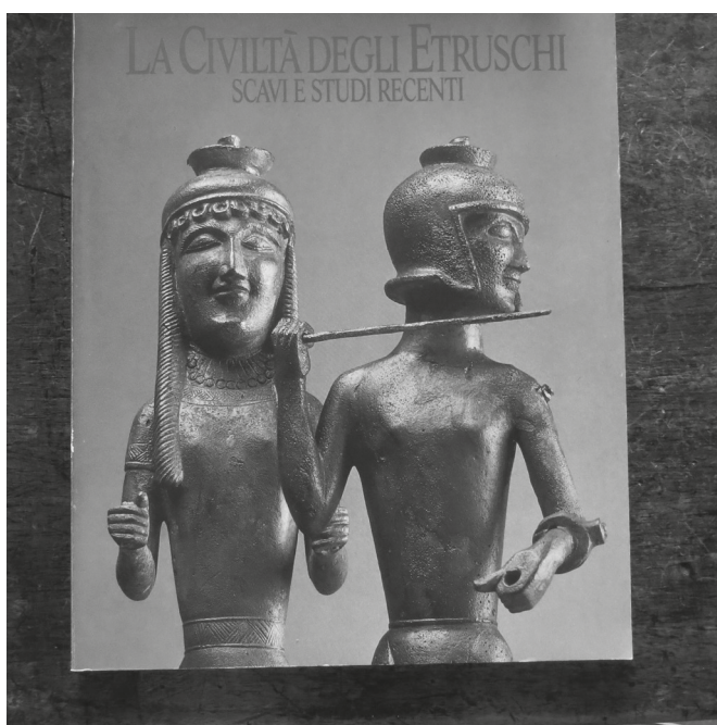
Fig. 2. Catalogo della Mostra "La Civiltà degli Etruschi" nel 1990 in Giappone.