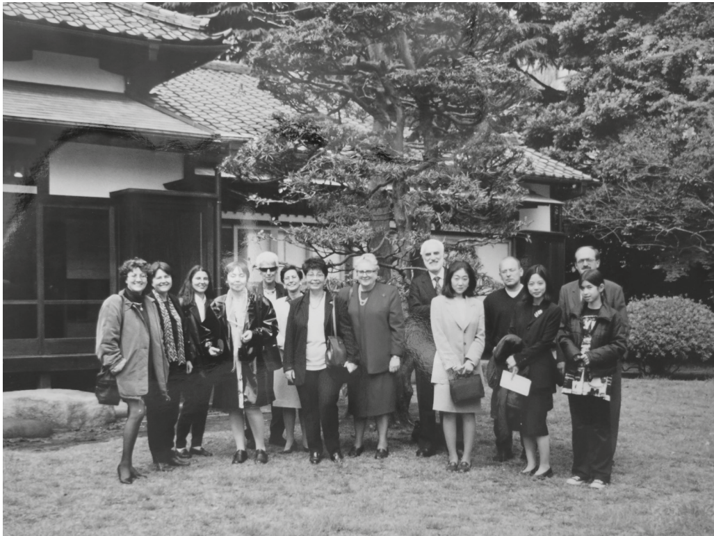
Fig. 10. Partecipanti del Convegno internazionale su "Hellenistic Painting" in aprile 1999 nel giardino della Tokyo University.