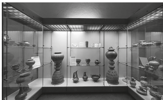
Fig. 3. Tarquinia, Museo Nazionale, primo piano, sala 2: Tomba di Bocchoris.