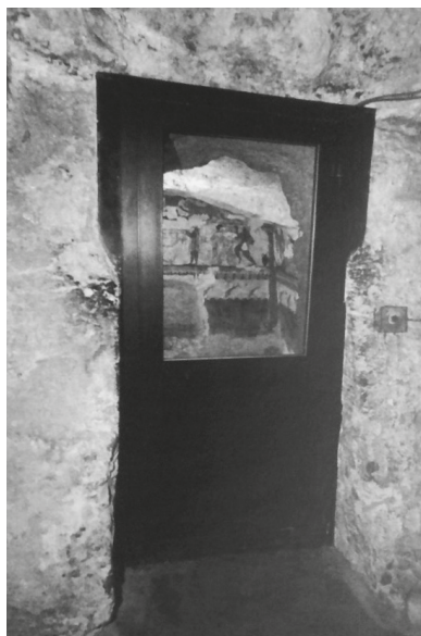
Fig. 2. Tarquinia, necropoli dei Monterozzi, loc. Calvario: la barriera trasparente climatizzata della Tomba delle Leonesse (da Cecchini 2012).