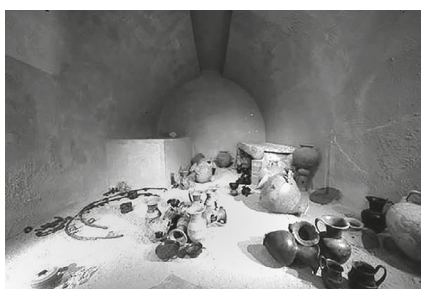
Fig. 4. Tarquinia, Museo Nazionale, piano terreno, sala 2: Tomba 6118, dei Versna.