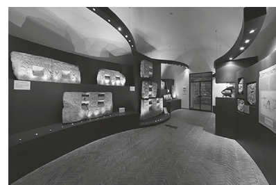
Fig. 5. Tarquinia, Museo Nazionale, piano terreno: l'esposizione della scultura arcaica tarquiniese, sale 2-3: sezione delle sculture tarquiniese.

Nel programma delineato con Mariolina intendevamo completare il percorso museale con l'allestimento del c.d. Salone delle Armi. Libero dai dipinti delle Tombe del Triclinio, delle Bighe, delle Olimpiadi e della Nave, esposte nel 1994 nelle sale climatizzate della sezione dedicata alla pittura etrusca, quel grandioso spazio, che in occasione del XXIII Convegno dell'Istituto di Studi Etruschi del 2001 aveva accolto la mostra "Tarquinia etrusca: una nuova immagine" 14 , doveva essere destinato all'esposizione delle testimonianze dell'antico centro urbano e del suo territorio. Avrebbero così trovato degna sede con quelle legate alla più antica storia dell'abitato, le fastose decorazioni architettoniche dell'imponente tempio dell'Ara della Regina, culminanti nel celebre altorilievo dei Cavalli Alati, adeguatamente valorizzato dal delicato intervento di restauro curato tra il 2000 e il 2004 da Ingrid Reindell sotto la guida di Mariolina 15 (fig. 6). Ai ritrovamenti provenienti dall'area urbana dovevano poi affiancarsi nelle comuni intenzioni quelli del suo porto, Gravisca, molti dei quali avevano già figurato