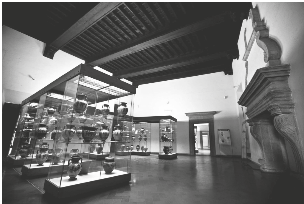
Fig. 5. Uno dei saloni del Museo Archeologico Nazionale di Tarquinia (foto da internet).

Quanto ricordato a titolo esemplificativo per il catalogo della Marroni, vale anche per il lavoro di Roberta Gabrielli sulla ceramica etrusco-corinzia 21 o quello di Danilo Nati sulla ceramica a figure nere 22 . Tutti sarcofagi della Tomba Bruschi hanno ricevuto un loro proprio numero di inventario, solo dopo l'accurato studio di Valentina Vincenti 23 . Sin dai primordi dello Stato unitario la catalogazione è stata concepita come strumento essenziale per conciliare gli studi delle discipline storico-artistiche e archeologiche con una riforma amministrativa del patrimonio che proprio allora si andava a concepire. Si pensi, per fare un esempio di altro ambito, all'operato di studiosi come Giovanni Battista Cavalcaselle e Giovanni Morelli incaricati nel 1861 dal ministro Quintino Serra di redigere «una nota particolareggiata di tutti gli oggetti d'arte, qualunque fossero, esistenti nelle chiese e presso gli enti religiosi soppressi» delle Marche e dell'Umbria, una schedatura poi pubblicata nel 1896 da Adolfo Venturi 24 . Si trattava di un'opera di catalogazione diretta alle autorità locali finalizzata alla tutela del patrimonio culturale per impedirne, con l'affermazione