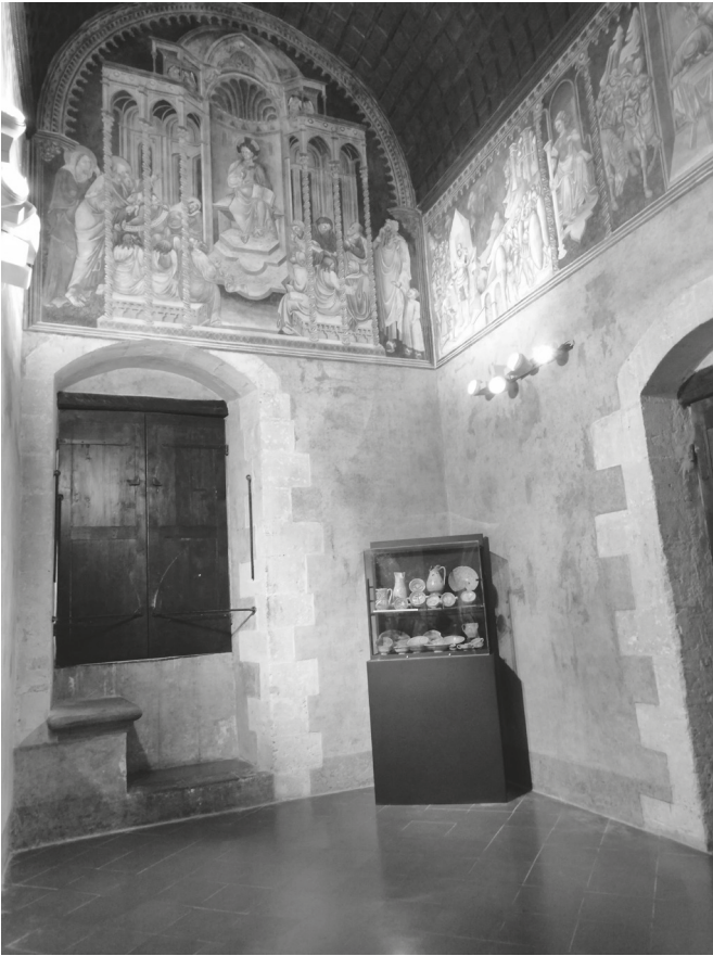
Fig. 6. Tarquinia, Museo Nazionale Tarquiniense, secondo piano, sala dello studiolo. Allestimento 2012.

in mattoni 12 , in opus spicatum 13 , in basoli 14 o in acciottolato 15 .