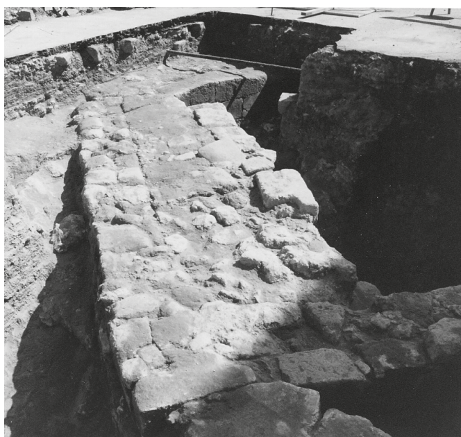
Fig. 4. Tarquinia, via di porta Castello, muraure rinvenute nel 1990 durante i lavori per il posizionamento della rete del metanodotto.