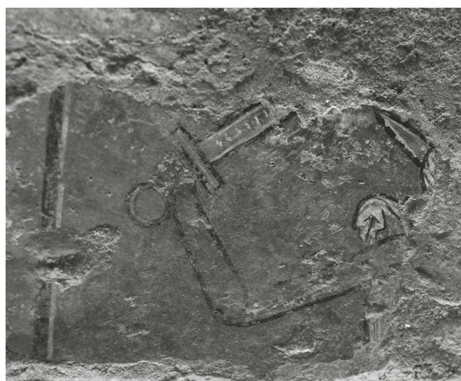
Fig. 5. Tarquinia, via di porta Castello, muraure rinvenute nel 1990 durante i lavori per il posizionamento della rete del metanodotto. Lacerti di affresco, in primo piano figura di un guerriero armato di spada.