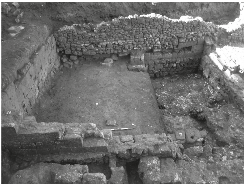
Fig. 3. Tarquinia, via di porta Castello, indagini 2006.