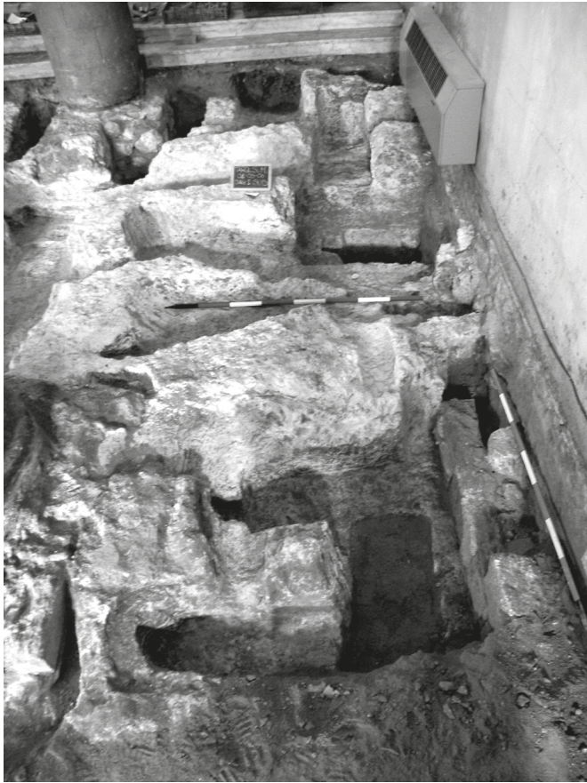
Fig. 1. Tarquinia, chiesa di S. Martino, indagini 2006.

I resti archeologici individuati durante gli scavi sono diversi e molteplici, aree cimiteriali connesse agli edifici di culto (figg. 1, 2), tratti della cinta fortificata, strutture murarie che in alcuni casi hanno restituito l'evidenza di singoli ambienti o parti di edifici più articolati, come nel caso delle strutture individuate nel 2006 in via di Porta Castello (fig. 3) e sempre nella stessa via quelle individuate nel 1990. Le strutture posizionate a sbarramento dell'attuale prima porta di Castello 7 , con muri, di notevole spessore (fig. 4), non subirono un abbandono determinato da un evento distruttivo quale potrebbe essere un incendio o un terremoto, ma un atto voluto funzionale alla costruzione delle nuove opere di fortificazione e trasformazione urbanistica dell'area. La costruzione della lizza muraria nella zona del castello avviene nel 1436, a seguito della donazione che Ranuccio Farnese fa al cardinale Giovanni Vitelleschi di un palazzo con quattro apothecae , posto