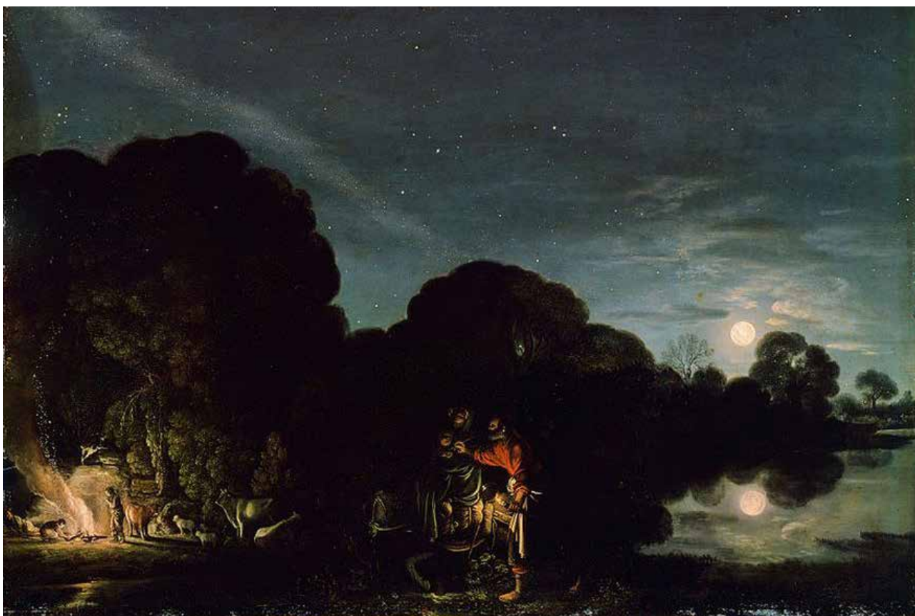
La fuga in Egitto di Elsheimer (1609).

Cesi e Stelluti, oppure commissionati a professionisti. L'apporto di Galileo all'Accademia sul piano metodologico e concettuale fu ancora una volta rilevante, non solo perché a questi libri dipinti Galileo contribuì (ad esempio all'edizione del Tesoro messicano ), ma anche perché a Roma – ma non solo a Roma – il metodo d'indagine e gli strumenti da lui perfezionati per favorire l'osservazione, il telescopio e il microscopio, mutarono radicalmente gli assunti della pittura e della ricerca scientifica 9 . ●