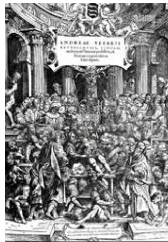
Frontespizio del De humani Corporis Fabrica di Andrea Vesalio

L'evento storicamente più evidente è che l'arte si rivelò essere un eccellente strumento divulgativo, tant'è che il suo incontro con la scienza fece nascere il nuovo genere dell'illustrazione scientifica; tuttavia, nonostante la minore evidenza, è epistemologicamente più interessante che oltre il suo ruolo divulgativo, l'arte fu stimolante sollecitazione per l'indagine scientifica: non è esagerato affermare che gli studi anatomici dei pittori contribuirono a far nascere l'anatomia moderna. Basti menzionare il De humani Corporis Fabrica di Andrea Vesalio, del 1543 4 , con