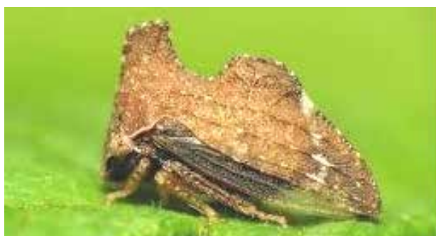
Entylia carinata (FORSTER 1771)

Non sappiamo né se, né come, né perché queste forme tridimensionali possano essere emerse attraverso la selezione naturale. È pur vero che l'esperimento ha coinvolto una sola una specie di membracide ed una sola specie di cicalina e che i due insetti sono stati campionati solo ad un certo punto del loro sviluppo da ninfe immature ad adulti completi con il pronoto sviluppato; ma se possiamo provare come sono avvenuti i primi cambiamenti, come quelli che hanno innescato tutta questa espressione genica simile ad un'ala, non sappiamo come i membracidi, antichi di 130 milioni di anni, hanno potuto ottenere tutte queste forme e soprattutto perché. Forse questi strani insetti ci dicono qualcosa sull'evoluzione