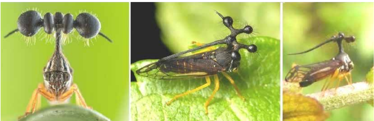
Bocydium globulare (FABRICIUS 1803)

Secondo alcuni l'aspetto del pronoto potrebbe aiutare a scoraggiare i predatori perché la sua forma può intimidire gli uccelli o gli anfibii che vogliono mangiarlo; secondo altri il suo aspetto fungerebbe da strumento di mimetismo, facendolo somigliare ad alcune specie vegetali. Si tratta di supposizioni non sostenute da prove; in realtà, sebbene biologi ed entomologi abbiano cercato per decenni il significato della sua morfologia, non sappiamo affatto se e quale ruolo svolga nella biologia di questo insetto. ●