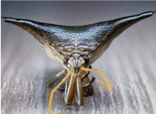
Stictocephala binsonia (KOPP & YONKE 1977)

due regioni, una remigante ( corio ) ed una anale ( clavo ) più interna. La nervatura alare è abbastanza ricca e dal vertice del clavo parte una nervatura submarginale nella quale confluiscono le principali nervature della regione remigante ( cubito , media , radio ) ed al cui esterno si estende una stretta membrana apicale. Le zampe posteriori di tipo saltatorio presentano coxe appiattite e poste trasversalmente (carattere tipico della famiglia), femori brevi ed ingrossati, tibie allungate e carenate longitudinalmente, con una sezione quadrangolare.