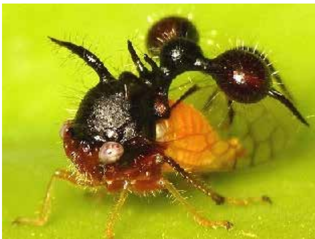
Imitazione batesiana di una formica da parte di un membracide

Nelle femmine l'ovopositore retrattile è in grado di praticare incisioni nei tessuti vegetali per deporvi le uova o facilitare l'accesso ai vasi flo-