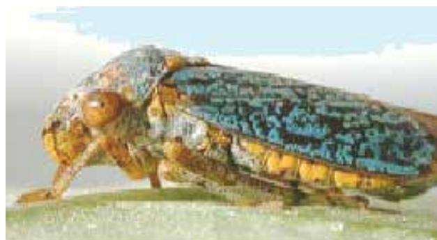
Homalodisca vitripennis (GERMAR 1827)

che ancora non riusciamo a comprendere. Alcuni ipotizzano che queste forme, così bizzarre ed ingombranti, e che non mostrano alcuna utilità funzionale, sarebbero semplici strutture ornamentali, ma l'evoluzione non persegue fini estetici.