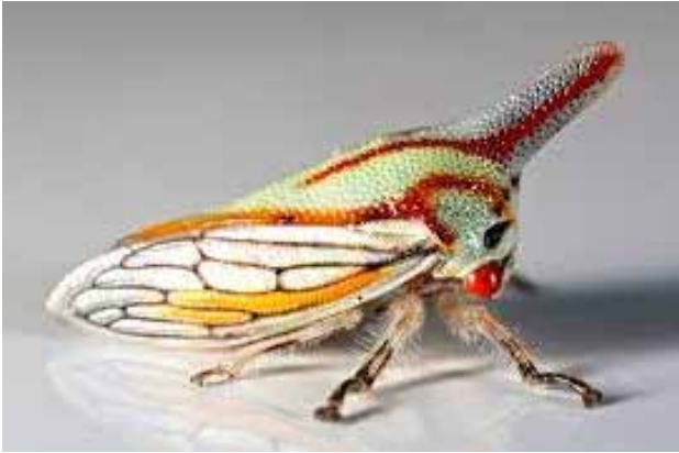
Platycotis vittata (FABRICIUS 1803)

La relazione mutualistica con le formiche spinge le femmine a preferire di ovideporre vicino alle loro colonie. Le formiche si prendono cura dei membracidi in qualsiasi fase della loro vita giovanile (uova, neanidi, ninfe). I ridotti tassi di predazione delle ninfe sono il risultato della protezione delle formiche e non delle cure dei genitori.