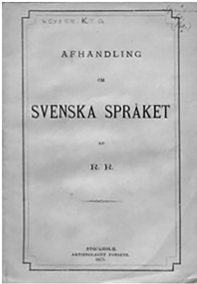
Fig 1. Frontespizio dell'opera di K.T.G. Keyser (1875).

La figura di Klas Teodor Gustaf Keyser (1823-1904), ufficiale della marina militare svedese, è di assai difficile ricostruzione, e di certo non può essere tentata qui: una rapida scorsa alla sua bibliografia 6 mostra un interesse poliedrico legato soprattutto agli aspetti filosofici sottesi alla comunicazione e al linguaggio in generale e ai linguaggi artificiali nello specifico (interesse che egli condivideva con Jespersen). L'opera del 1875, ed in particolare la parte dedicata alla sintassi, presenta una ripresa del principio aristotelico legato alla metafisica implicita del linguaggio (1875: 86), organizzato in classi che esprimono, o rappresentano,