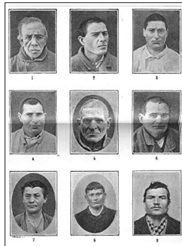
Fig. 2. Tipi di delinquenti italiani (Lombroso, 1897, 4: tav. XLVI, risorsa di pubblico dominio).

Nelle pagine di spiegazione precedenti le tavole dell' Atlante , i lineamenti, quali tratti distintivi, venivano descritti come i segni della criminalità e dell'appartenenza a una determinata categoria di delinquente in quanto indicatori del reato di cui si era macchiato. Se il viso asimmetrico e sproporzionato e la presenza di anomalie craniche costituivano le caratteristiche basilari del criminale, più in particolare, il ladro presentava generalmente una fronte definita «sfuggente» e dei lineamenti (naso, zigomi, mandibola, orecchie) catalogati come «enormi», mentre l'omicida aveva solitamente «rughe frontali» e «labbra sottili» (Lombroso, 1897, 4: VII-XI), tratti combinati tra loro nei casi di delinquenti macchiatisi di più e diversi reati (il caso del delinquente ladro e omicida). Per questo motivo, l' atlante costituiva